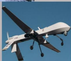
3)БЕСПИ- ЛОТНАЯ СИСТЕМА